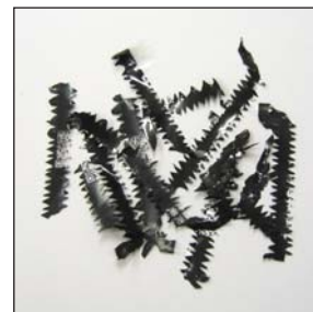
▲ジグソーパズルカット

IRS-09は、使用済みのインクリボンに残る個人情報を細断し、廃棄処理のセキュリティを高めます。細断処理されたインクリボンは、回収ボックスに収納され、コンパクトに回収することができます。