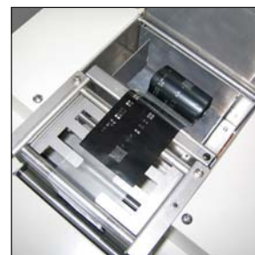
▲シュレッダーヘッド部

IRS-09は、簡単な操作で使用済みインクリボン細断処理の高速処理することが可能です。また、わずかなランニングコストで完全な機密保護を可能とします。